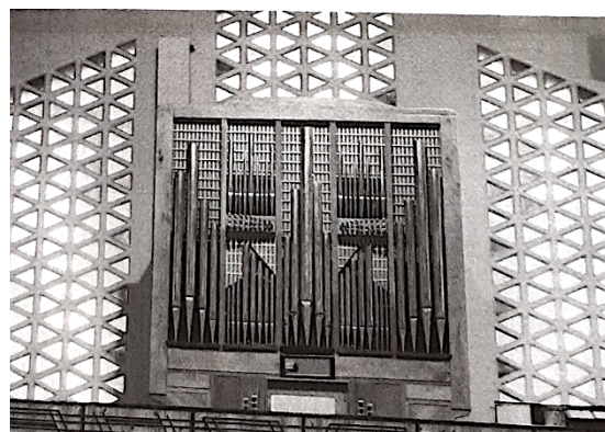
Orgue d'Hagondange-centre. On voit que les 2 buffets d'origine ont été assemblés pour n'en former qu'un seul.

Merci à toutes les personnes qui ont à cœur de transmettre et de faire vivre l'histoire de notre patrimoine. Que la beauté nous fasse goûter « la joie de la foi » !